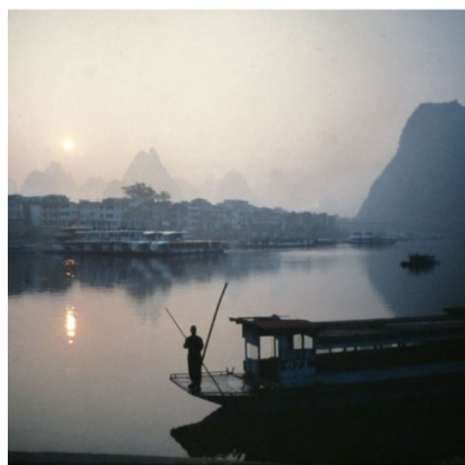
KINA. Morgenmotiv fra floden i byen Yangshuo i Kina.