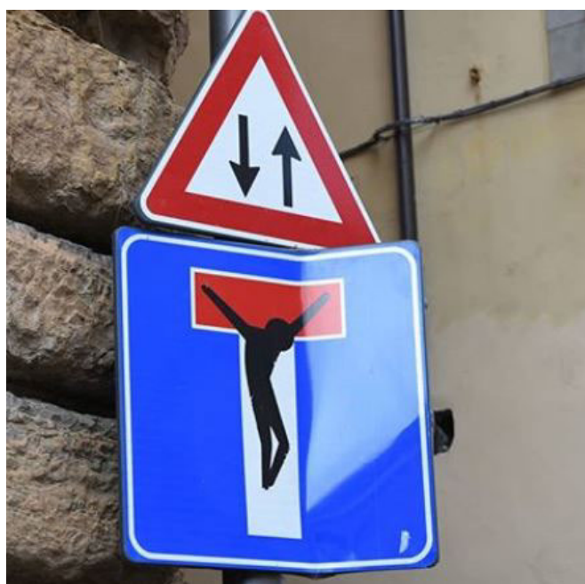
ITALIEN. Firenze er fyldt med gadekunst, som ikke kun er malet på murene.