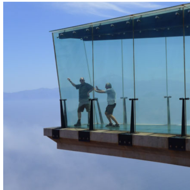
SPANIEN. Man kommer ud over kanten i Mirador de Abrante på øen La Gomera.