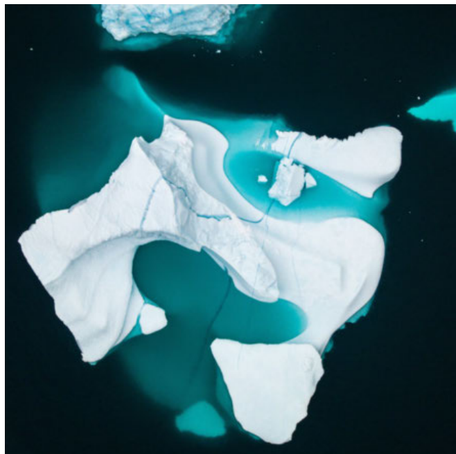
GRØNLAND. Isbjerg fotograferet fra en drone i 30-40 meters højde.

Hver uge bringer vi læsernes gode rejsefotos. Send dit bedste foto med en kort beskrivelse af motivet (maks. 100 tegn) til guide@pol.dk , eller 'tag' det på Instagram med #politiken_rejser . Hver uge præmieres et billede med en 'Turen går til ...'-bog. Ugens vinder: @travelling_family