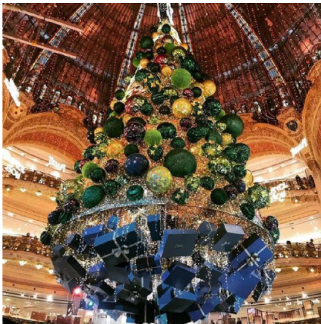
FRANKRIG. Stormagasinet Galeries Lafayette i Paris har tradition for overdådig julepynt.