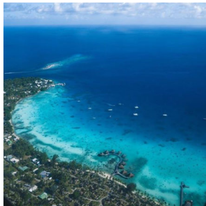
FRANSK POLYNESIEN. 50 nuancer af blå på Rangiroa, som er hovedø i Fransk Polynesien.