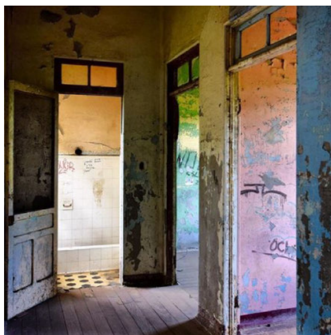
COSTA RICA. Yndefuldt forfald i Sanatorio Dr. Carlos Durán Cartín.